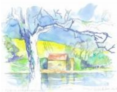
Illustration: Inger Dethlefsen, Færgevej 26, 6430 Nordborg,